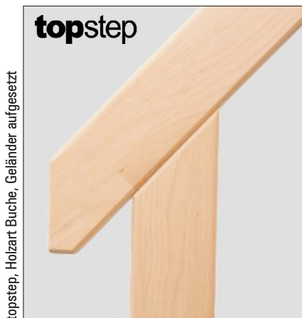
topstep, Holzart Buche, Geländer aufgesetzt

Der liefert in nur 4 Stunden eine maßgenaue Zeichnung für Ihre topstep. Bei midstep prüft er den verfügbaren Bereich und die Kopffreiheit. Oder nutzen Sie rund um die Uhr www.wellhoefer.de