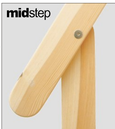
midstep, Holzart Kiefer, Geländer angeschraubt

Sie haben Fragen? Wir beraten Sie gerne: